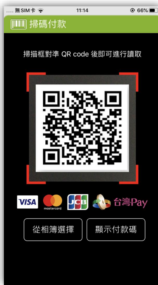
Step2 掃描稅款「QR Code」